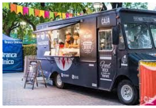
Standmöglichkeit für Foodtruck